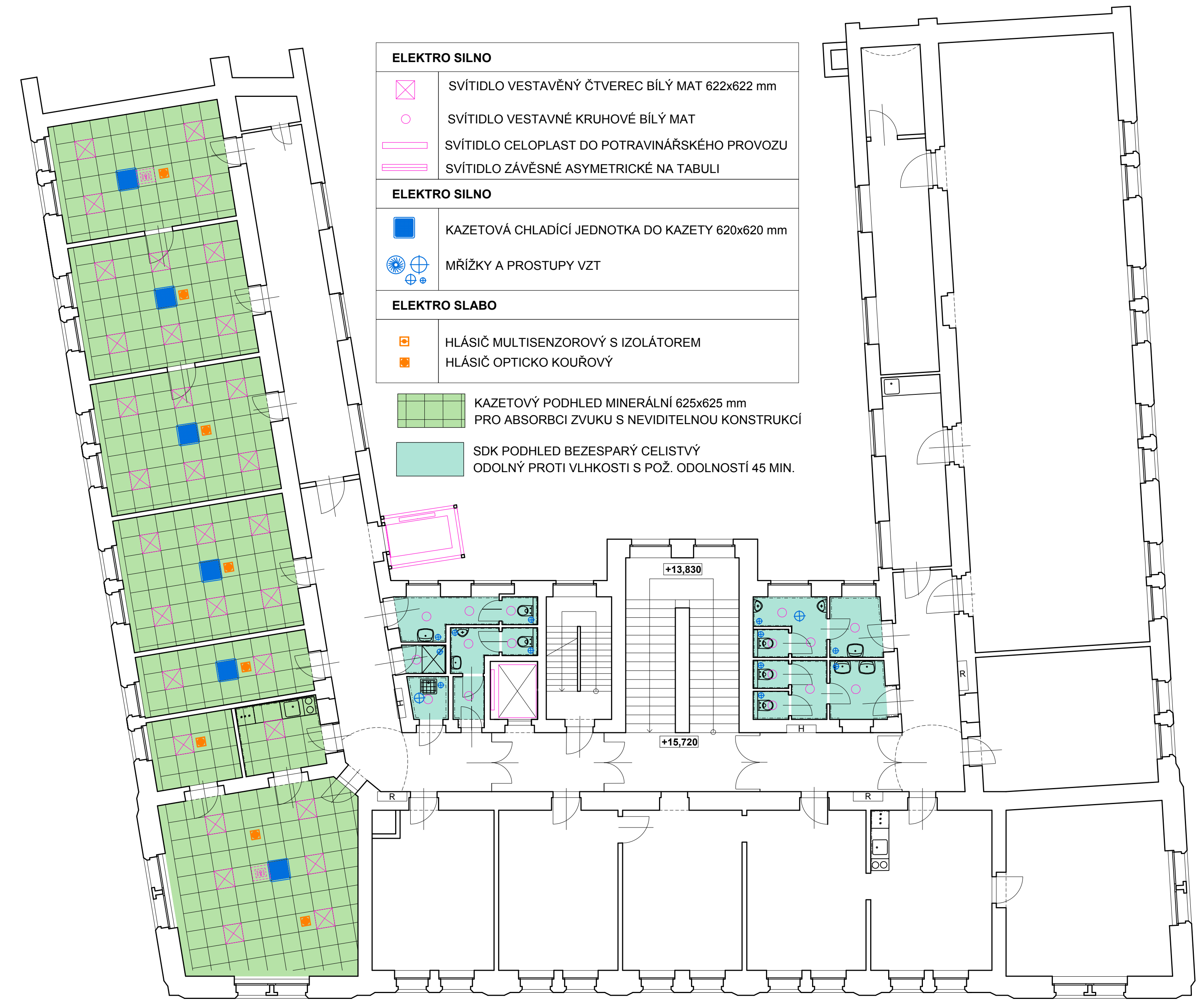
KOORDINACE PRVKŮ POUZE V PODHLEDECH . PŘESNÉ ROZMĚRY PRVKŮ V JEDNOTLIVÝCH PROFESÍCH 5.N.P.

Materiály, které jsou případně jmenovitě uvedené v projektu a ve výkazu výměr, nejsou podle zákona č. 134/2016 Sb., o zadávání veřejných zakázek, závazné, ale jsou reprezentanty určeného kvalitativního standardu. Pokud zadávací dokumentace, resp. projektová dokumentace a výkazy výměr obsahují požadavky na určité obchodní názvy nebo odkazy na obchodní firmy, názvy nebo jména a přijetí nebo jsou pro jeho organizační složku příznačné, např. patenty na vynálezy, užité vzory, průmyslové vzory, ochranné známky nebo označení původu, účastník to při zpracování nabídky bude chápat jako vymezení kvalitativního standardu. Zadavatel umožňuje použití i jiných, kvalitativně a technicky obdobných řešení, pokud bude vymezený kvalitativní standard dodržen nebo bude mít lepší parametry.